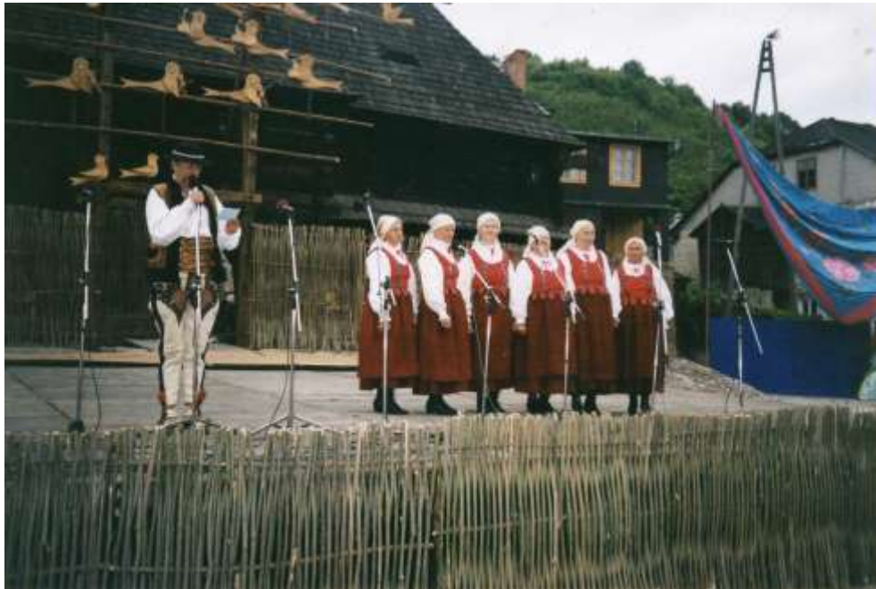
Występ zespołu „Łomniczanki” w Kazimierzu Dolnym