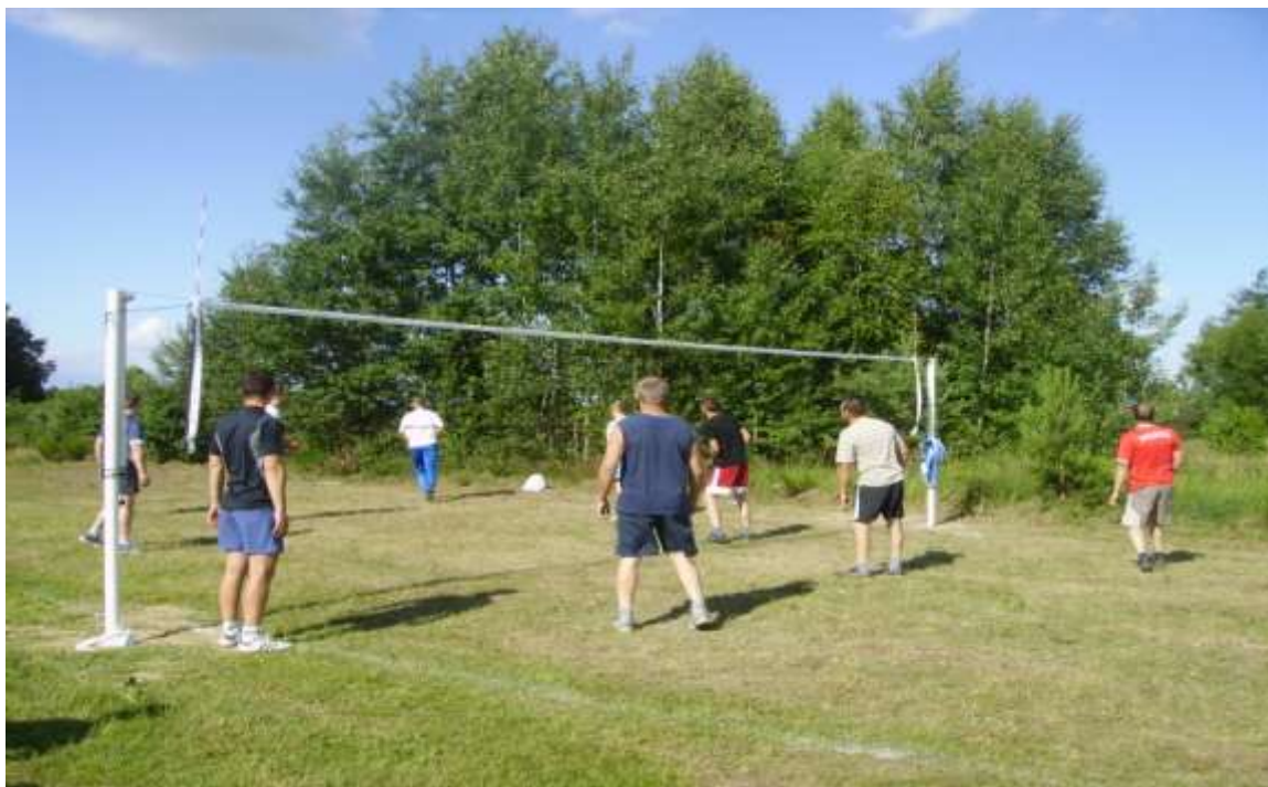
Mieszkańcy Łomnicy podczas otwarcia boiska do siatkówki w 2011r.