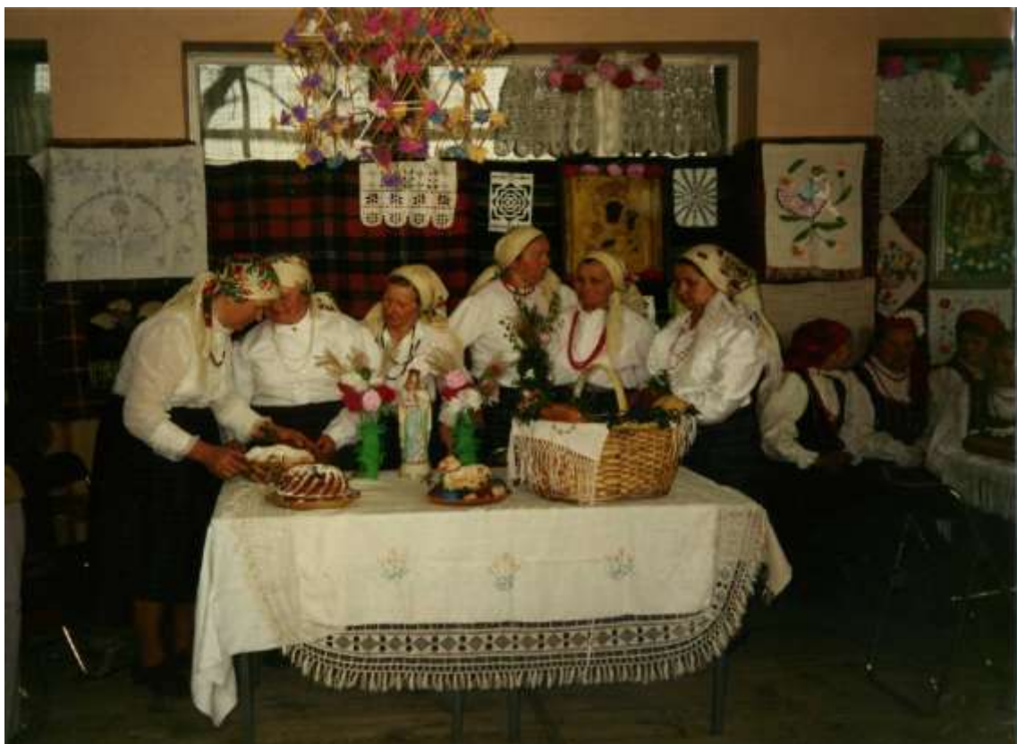
Zespół „Łomniczanki” podczas wystawy Tradycje Wielkanocne w Siedlcach