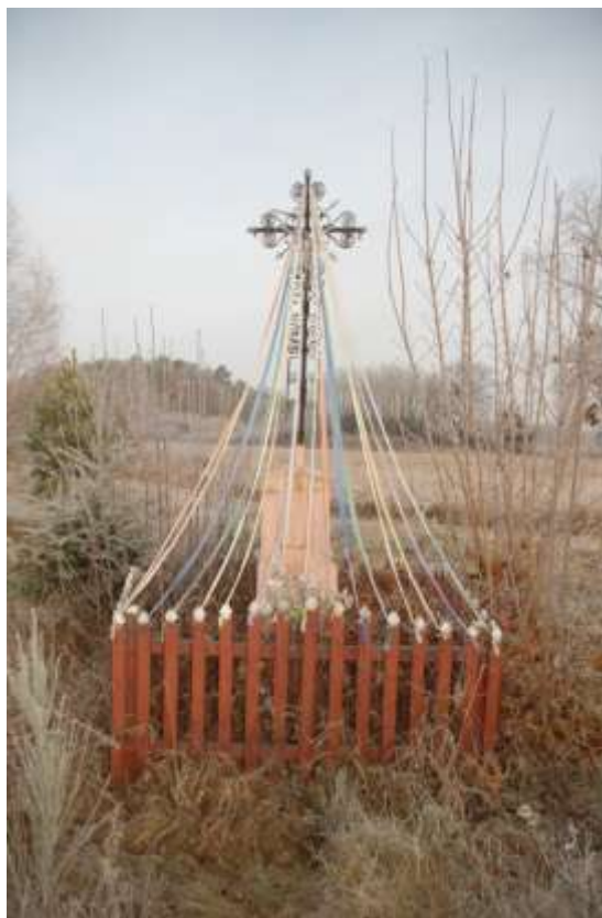
Obiekty małej architektury znajdujące się na terenie wsi Łomnica