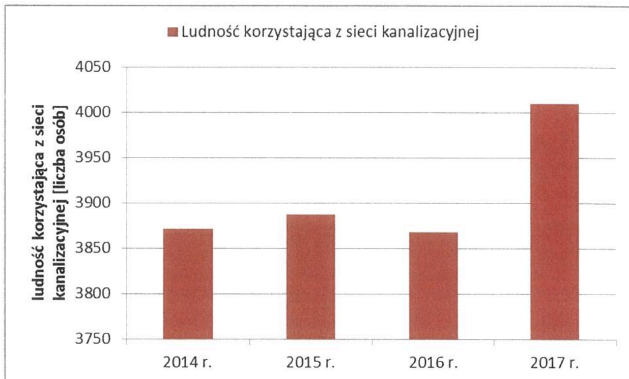
Wykres. 2. Ludność korzystająca z sieci kanalizacyjnej w latach 2014-2017